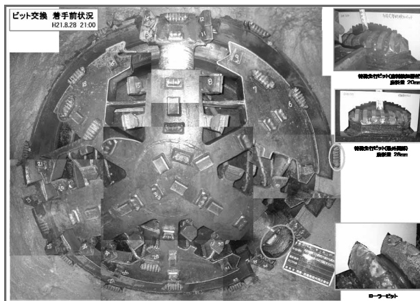
写真-2 人力掘削完了（吹付養生）