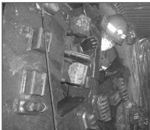
写真-1 スリット部開口設置

写真-3 に示すように、磨耗検知装置を埋め込んだビットの磨耗量は 26mm で、検知装置のデータと一致していた。また、チップの欠けは散見されたが、磨耗検知装置のデータからの推定状況と大きな差は見受けられなかった。したがって、今後残り 1.4km を掘進するために、今回の磨耗実績から推定・検討を加え、仕事量の大きい \phi 1,220 \text{mm} よりも外周側のすべてのビット 28 個を交換、最外周部に 6 個増設することとした（図-5）。