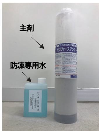
写真-1 「セメフォースアンカー寒冷地仕様」の外観