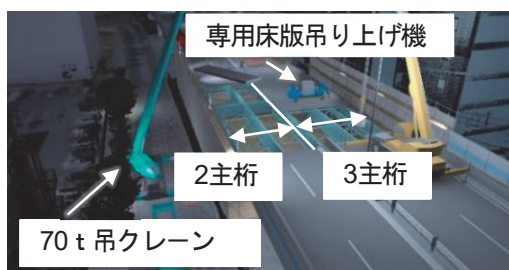
図-1 神S360(5主桁)床版撤去概念図