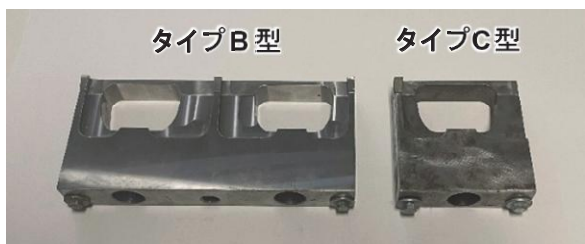
写真-2 仮補強に用いる鋼製補強部材