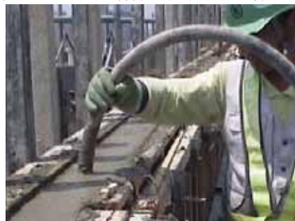
写真-2 φ40mmバイブレータによる再振動の状況

③締固め後30分を目安に、再度、バイブレータφ40mmにて締固めを実施した。なお、引き抜き速度は10cm/秒程度 2) のゆっくりとした作業を行うことを徹底した。