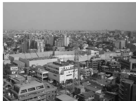
写真-4 近隣が住宅で囲われている現場の風景