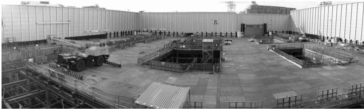
写真-1 様々な作業が同時に行われる工事現場の全景