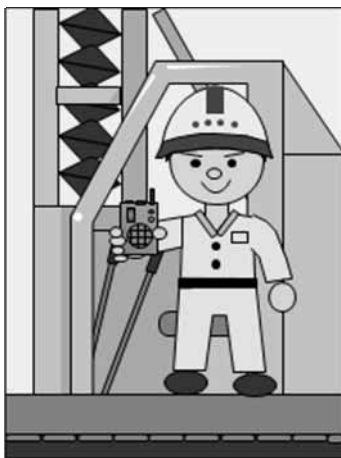
図-3 携帯型警報器を持つ重機のオペレータ