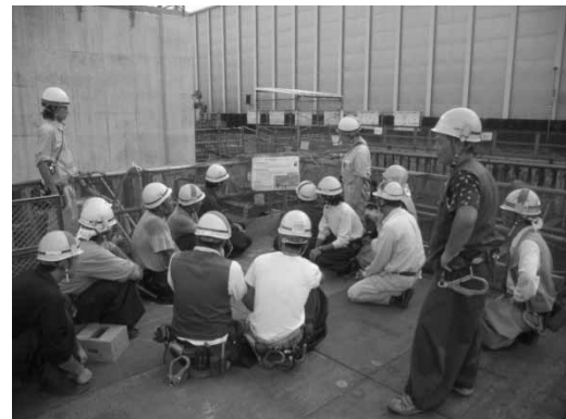
写真-2 作業員への安全教育