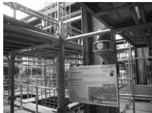
写真-3 警報機とポスターの設置状況