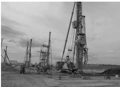
写真-5 地盤改良工事現場の全景