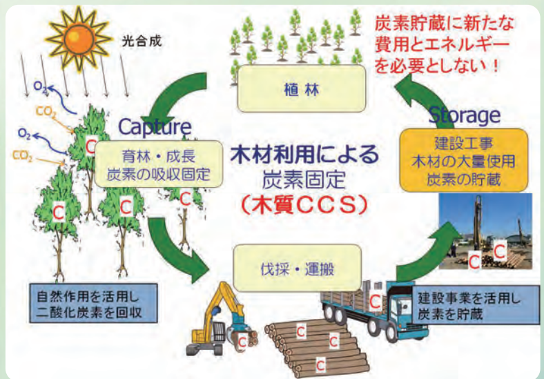
図-2 炭素貯蔵の原理

樹木は、光合成により大気から二酸化炭素を吸収し、炭素を樹木として固定して、酸素を出します。樹木の成長は、大気からの二酸化炭素の削減そのものです。樹木から丸太を伐り出し、LP-SoC 工法で用いれば、丸太は腐ることなく炭素を半永久的に地中に貯蔵できます。LP-SoC による炭素の貯蔵量は、工事によって排出される二酸化炭素量よりはるかに多く、工事をすればするほど温室効果ガス削減に貢献します。丸太を用いて CCS と同様な効果を期待できます。